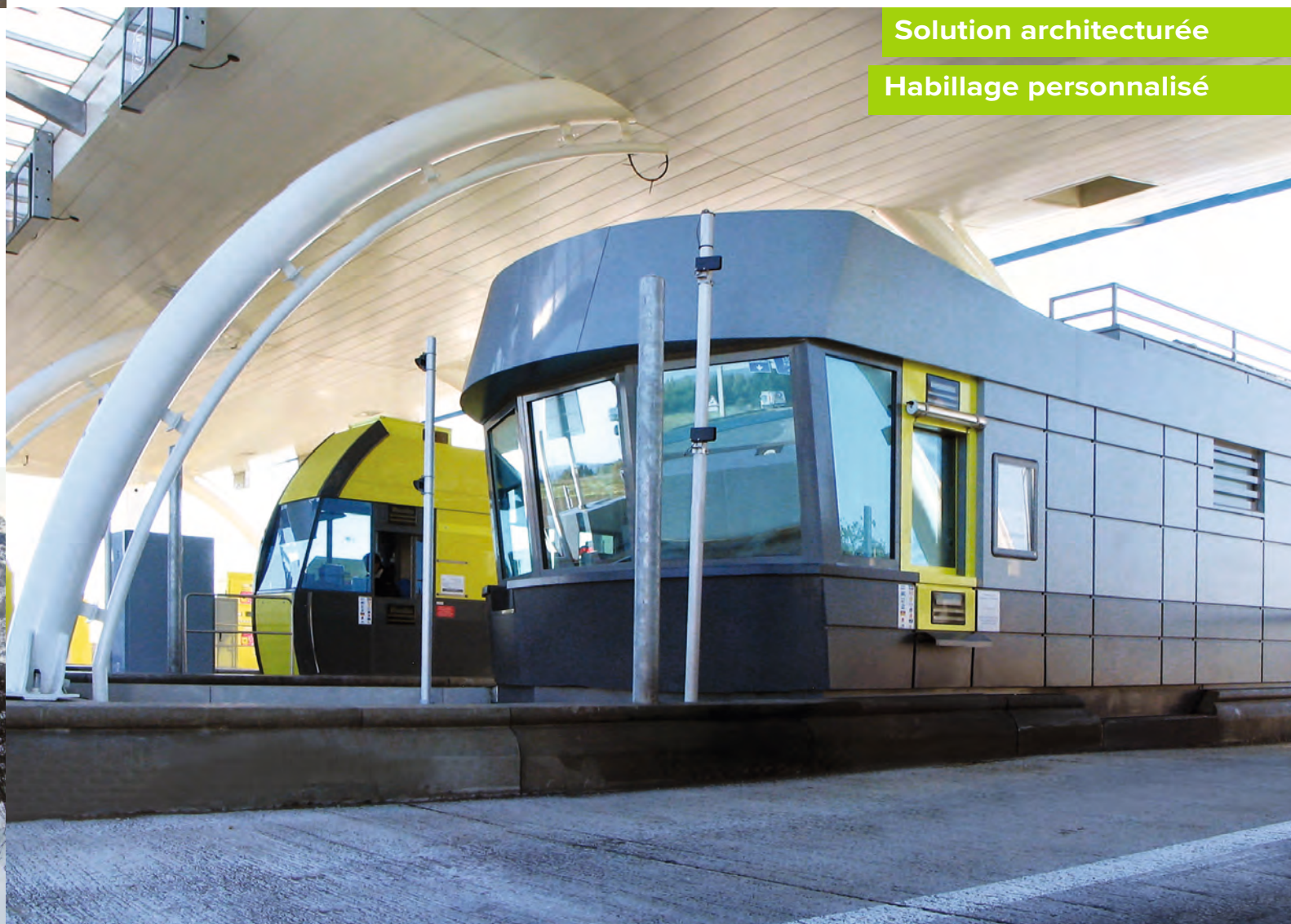
Solution architecturée Habillage personnalisé