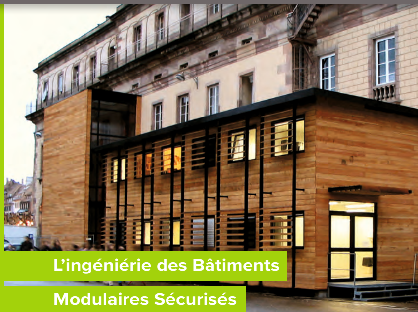
L'ingénierie des Bâtiments Modulaires Sécurisés