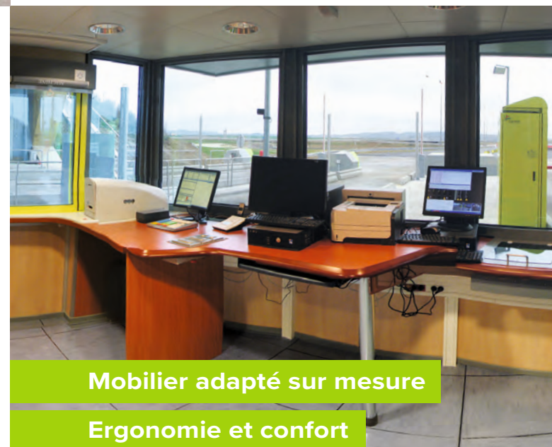
Mobilier adapté sur mesure Ergonomie et confort

Une pré-réception est habituellement prévue en usine et nous nous engageons au travers d'un PPSPS à livrer et assembler nos modules à la date prévue et dans les délais les plus courts. Un dossier d'ouvrage exécuté avec fichiers plans Autodesk est remis au client lors de la réception finale.